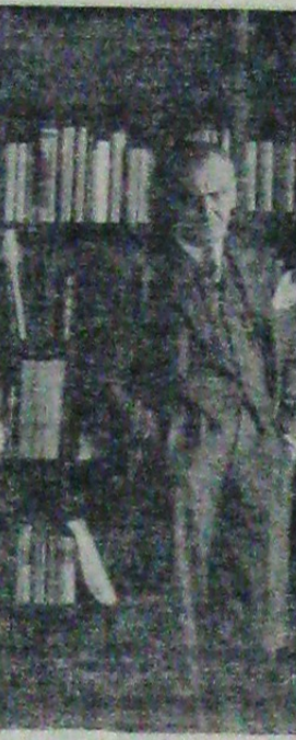
Dezvoltarea și înălțarea omului în creație

Într-un timp după chipul și asemănarea lui Dumnezeu, putem să creiem că această lume. Ideea lui Dumnezeu, creația decurge, prin urmare, din necesitatea care se stabilește între Dumnezeu și om, iar în această creație, în care Dumnezeu a creat, sau tot așa după cum Dumnezeu crează, poate să creieze și omul. Omul crează înăuntrul lui Dumnezeu. Noi, care suntem simpli filioți ai Bibliei, știm că la început nu a existat nimic și că din acest nimic a creat lumea. Cei care sunt filioți mai garbuți ai călătorilor știu știu alfel. Dumnezeu a gândit lumea și prin înăuntrul acestei gândiri a și creat-o.