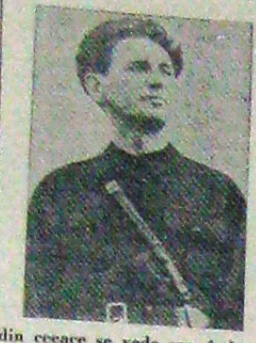
Un tânăr legionar în uniformă, în timpul unei activități.

Voră lui 1933 se desfășura calm, din punct de vedere politic. Ouzul de sub președinția lui Valde, după o serie de măsuri pe care fusese obligat să le ia pentru stăpânirea activității Gărzii de Fier, acum își depina activitatea în rîm obligativ, neplăcut — după ritualul democratic — deschiderii Corpului Legionar.